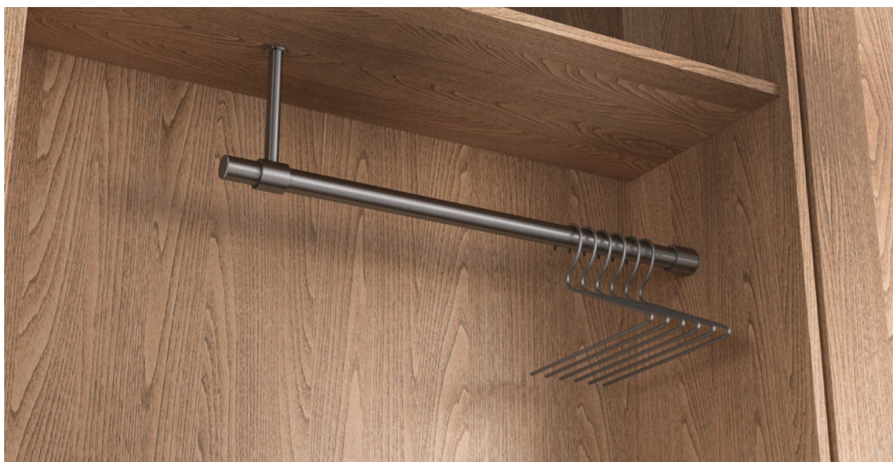
Artikel: 1025.595.10 L